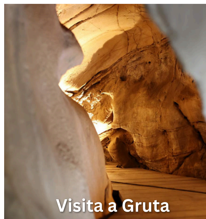
Visita a Gruta