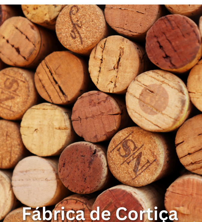
Fábrica de Cortiça