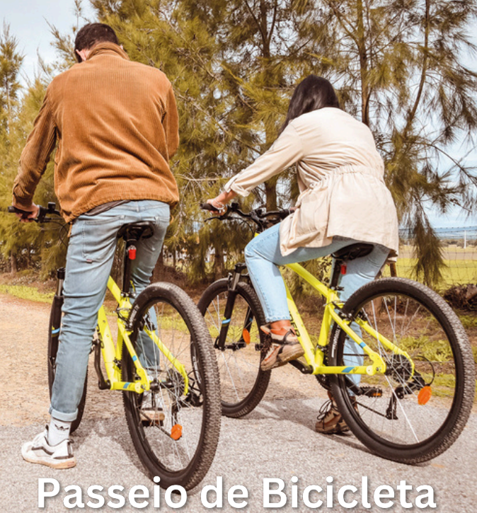
Passeio de Bicicleta