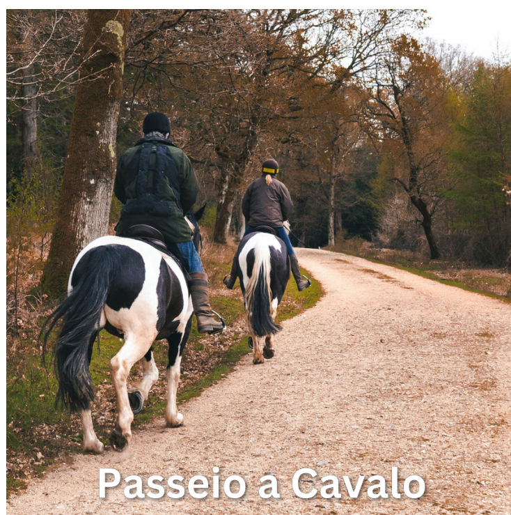
Passeio a Cavalo