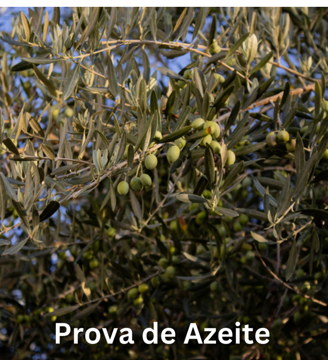
Prova de Azeite