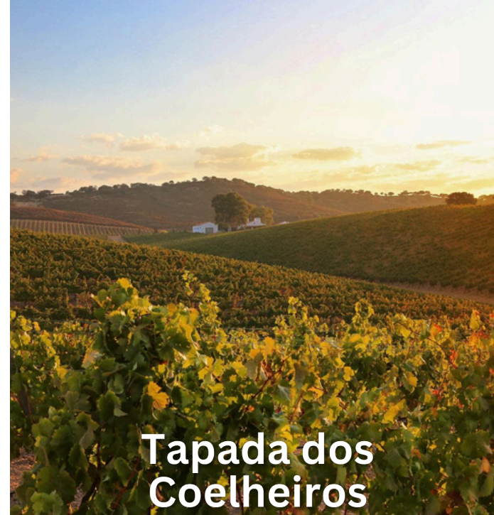
Tapada dos Coelhos