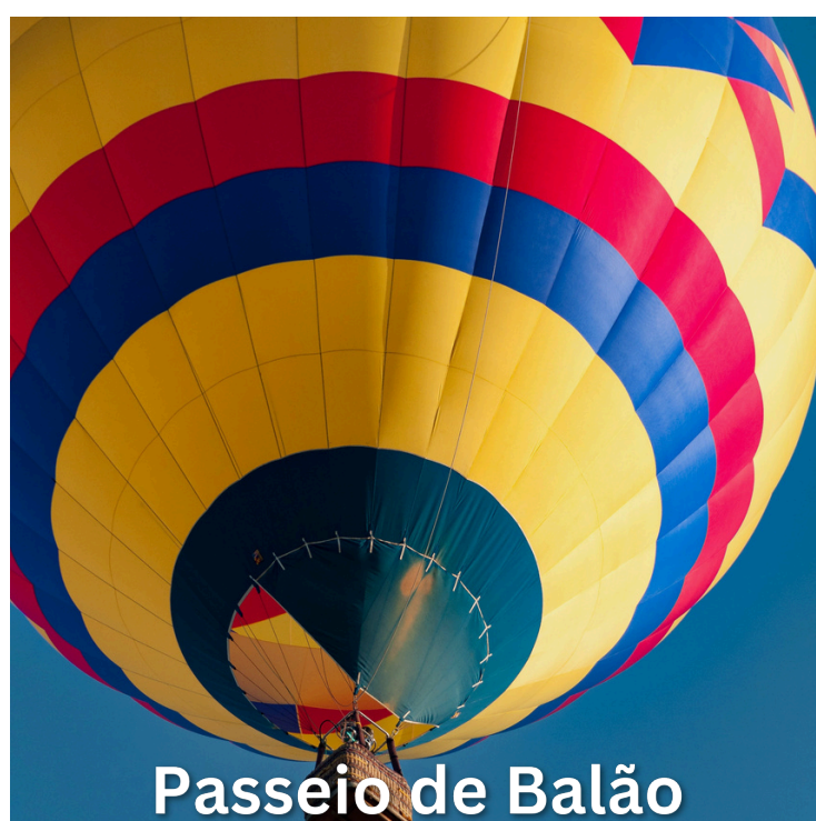
Passeio de Balão